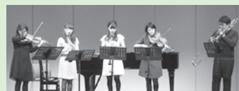
(昨年のステージから)

クラシックの名曲からみんなで歌えるお馴染みの曲まで 声楽やピアノ・器楽の演奏をファミリーでお楽しみください。