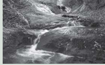
第4回 特選「晩秋の十八丁川」 辻森寿美

西宮市の山口地域は、季節ごとに大きく姿を変える豊かな自然や古くから続く勇壮な祭りなど、様々な魅力を持ったまちです。あなたの心に触れた西宮山口の風景・文化を写真で表現して下さい。