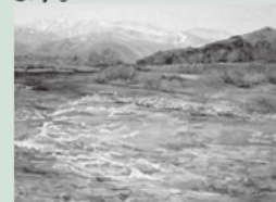
「雪解け水流れる川」