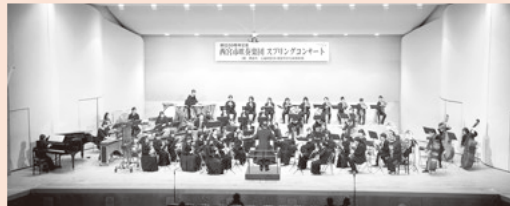
前回のステージから