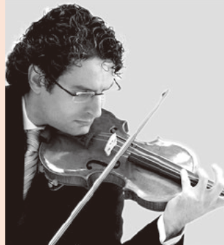
ヴァイオリン：マウロ・イウラート

西宮音楽協会がお届けするチャリティークラシックコンサート。音楽を通して、命の大切さを考え、今も大変な生活をされている被災地へ「心」を伝えましょう。チケットの売上金および募金は、西宮市の支援する、宮城県女川町・南三陸町の小・中学生の音楽教育のために役立てます。一緒に支援の輪を広げましょう。