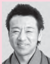
笑福亭恭瓶 桂 吉坊 笑福亭大智

毎年恒例の「ゑびす寄席」。 今年から小中高生は500円! みなさんでお楽しみください。