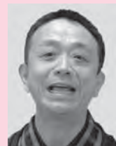
露の団四郎 桂 文三 笑福亭高介