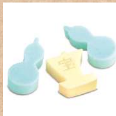
十月十日 こはく 『宝箱』