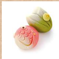
十二月十日 菓一條栄久堂吉宗 『福笹・鯛』