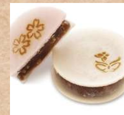
十一月十日 和菓子所 桔梗堂 『えびすの四季』