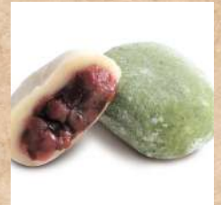
七月十日 あおやま菓匠 『えびす大福』