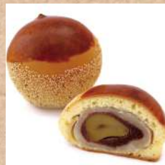
九月十日 君栄堂本舗 『戒福栗』