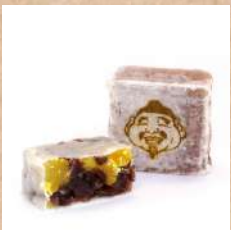
二月十日 谷矢製館 『えびす金鑄』