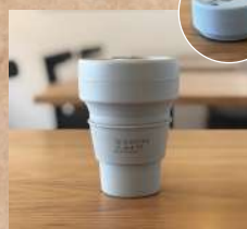
折りたためるマイカップ stojo (COFFEE GATEロゴ入)