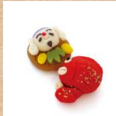
四月十日 千鳥屋宗家 『えべっさん・鯛みくじ』

発信事業実行委員会」が中心となってスタートしたプロジェクトで、市内11店の和菓子店が「えびすさま」にちなんだお菓子を特別に考案し、1年を通して毎月10日限定で販売される、幻ともいえるお菓子なのです！その「とおかし」の2021年度のラインナップが揃ったということでご紹介しちゃいます！