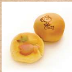
八月十日 翁菓舗 『福笹・打出の小槌』