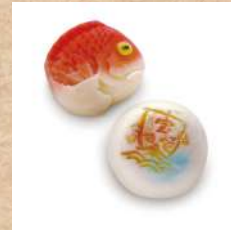
六月十日 御菓子司 昇月堂 『めで鯛・宝舟』