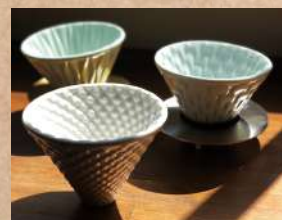
LOVERAMICS BREWERS ドリッパーセット Coffee Dripper+ Dripper Stand 各1個