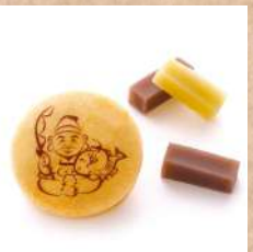
三月十日 成田屋 『えびす舞』