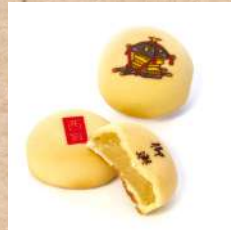
五月十日 高山堂 『御輿屋まんじゅう』