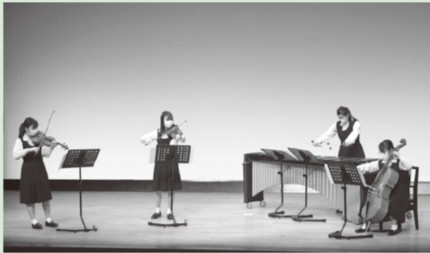
前回のステージから