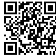
オンラインフォーム・団員募集HP

■お問合せ (公財)西宮市文化振興財団 TEL 0798-33-3146(平日9:00～17:30)