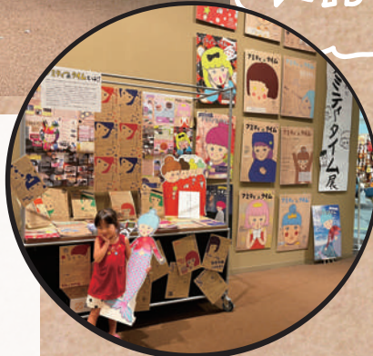
最近子供にも人気のアミ子♡

西宮にあるアミティ・ベイコムホール発の広報紙。表紙を飾る「アミ子」というキャラクターが目印♪ ダンスや音楽、アート等、文化芸術の楽しさをもっと身近に感じてほしい! 気軽に楽しんでほしい! という気持ちで2017年から広報紙を作り続けています。アミティホールがある西宮市民会館はもちろん市内公共施設や近隣のお店などでも配布中! ここにも設置できるよ! の情報も常に募集中です。