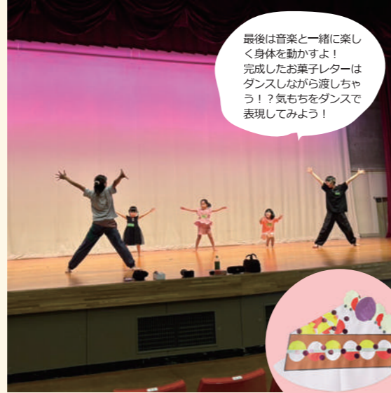
最後は音楽と一緒に楽しく身体を動かすよ！完成したお菓子レターはダンスしながら渡しちゃう！？気もちをダンスで表現してみよう！

絵の具や装飾パーツを使って世界で1つのお菓子型のお手紙を制作！大好きな人にメッセージも書いてみよう！