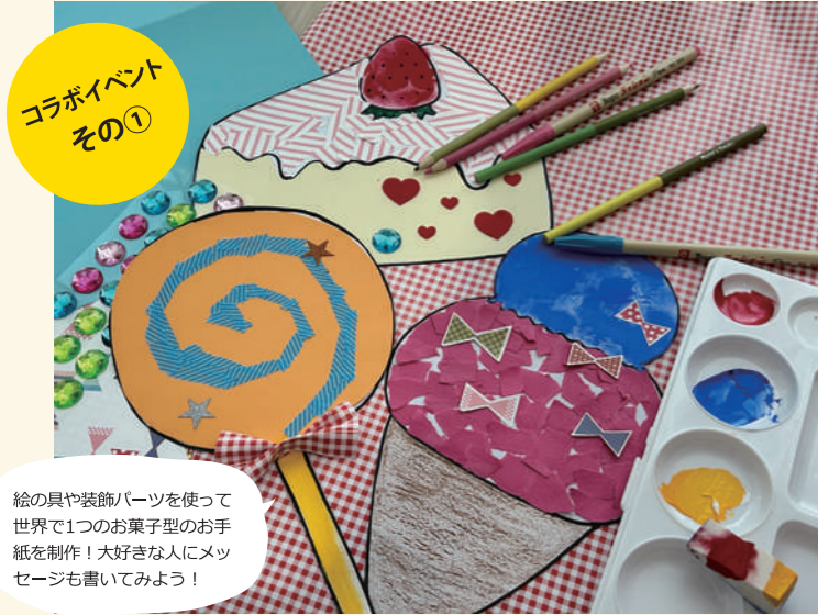
コラボイベント その①

エビスタ西宮が毎月地域団体と一緒に体験やワークショップで学び合える場を提供しているコミュニティ応援イベント【WATASHINOまなびば】。その2月開催分を西宮市文化振興財団がプロデュース！財団ならではのネットワークにより、いつもとちょっと違う「文化芸術とまなびの場」をエビスタ西宮にて開催します。2/8、2/15の2回開催！当日は会場に直接お越しください（10:30より先着）！お買い物以外でも特別なワークショップでエビスタ西宮を楽しもう♪