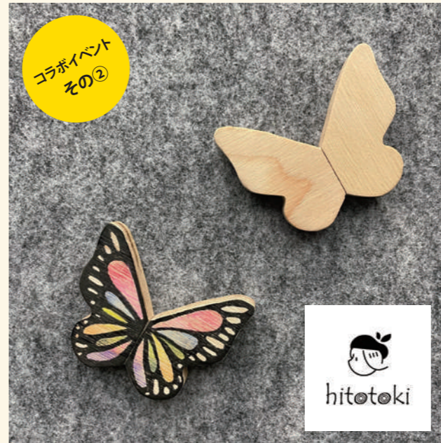
コラボイベント その②