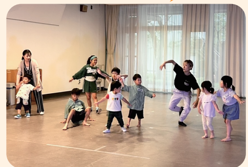
昨年度 HixTO ワークショップ